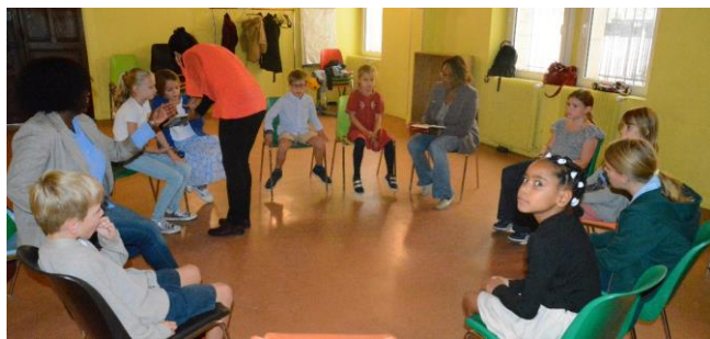
Les activités Jeunesse de Batignolles [Sept. 2022]