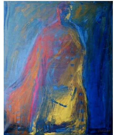
Paul, de Macha Chmakoff, Huile sur toile

Pour certains commentateurs, on peut même remonter à 50-52 (hypothèse du double passage de Paul en sud-Galatie), ce qui ferait de cette épître un des plus anciens textes de Paul, pratiquement contemporain de 1Thim.