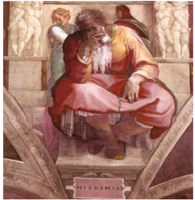
Le prophète Jérémie, par Michel-Ange, 1511-1512 Chapelle Sixtine, Vatican

Le principal acteur, dans le livre de Jérémie, est la parole de Dieu. Cette parole possède une force qui lui permet de triompher de tous les obstacles. Elle s'impose aussi bien aux auditeurs qu'au prophète. Comme chez les autres prophètes, cette parole énoncée par le prophète est une parole de jugement. Mais, dès la vocation de Jérémie, on voit que la parole n'aura pas uniquement pour but la dénonciation du mal, mais aussi l'édification et la restauration de quelque chose de neuf. C'est une parole efficace car Dieu veille à son accomplissement. C'est bien le sens de la vision inaugurale de l'amandier (1,11-12). Cette parole est donnée au prophète, littéralement «mise dans sa bouche» (1,9). C'est une parole qui s'impose aux hommes, même si ceux-ci ne désirent pas la recevoir. L'écrit est vulnérable, on peut s'en emparer et le détruire comme le fera effectivement le roi. Mais si le livre est brûlé, la parole demeure et on pourra toujours réécrire un nouveau livre. La parole s'impose également aux hommes par son accomplissement. Ce qu'elle annonce advient. Les manœuvres des hommes n'y peuvent rien. Mais cet accomplissement inéluctable de la parole devient aussi facteur d'espérance lorsqu'elle annonce un futur rétablissement.